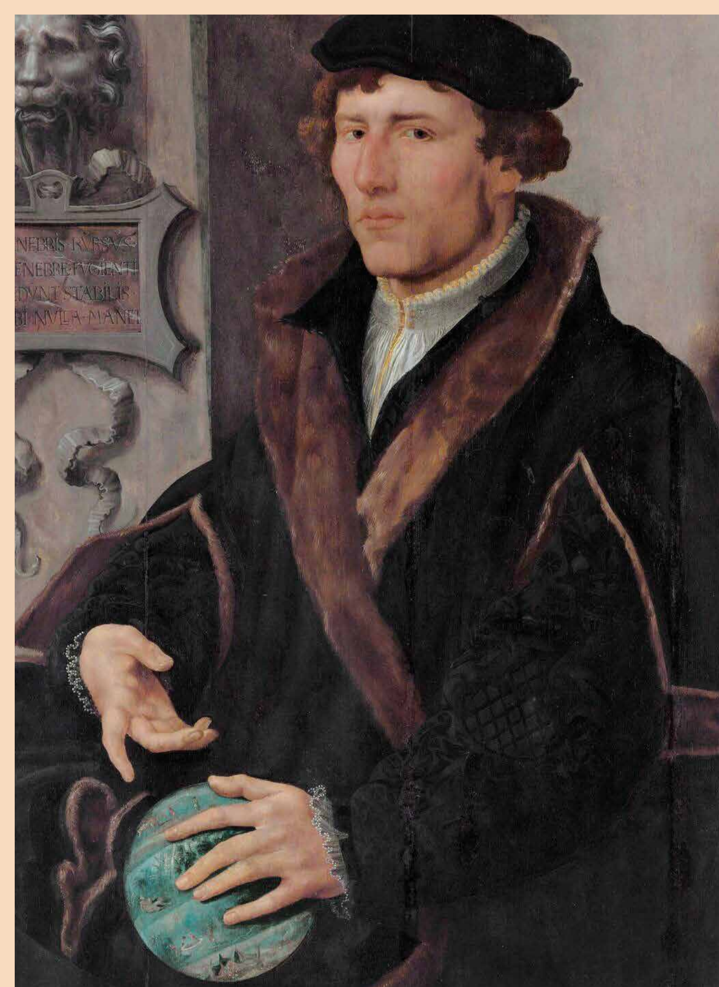
Fig.3. Frisius segons una pintura del segle XVI de Maarten van Heemskerck. Col·lecció del museu Boijmans Van Beuningen.