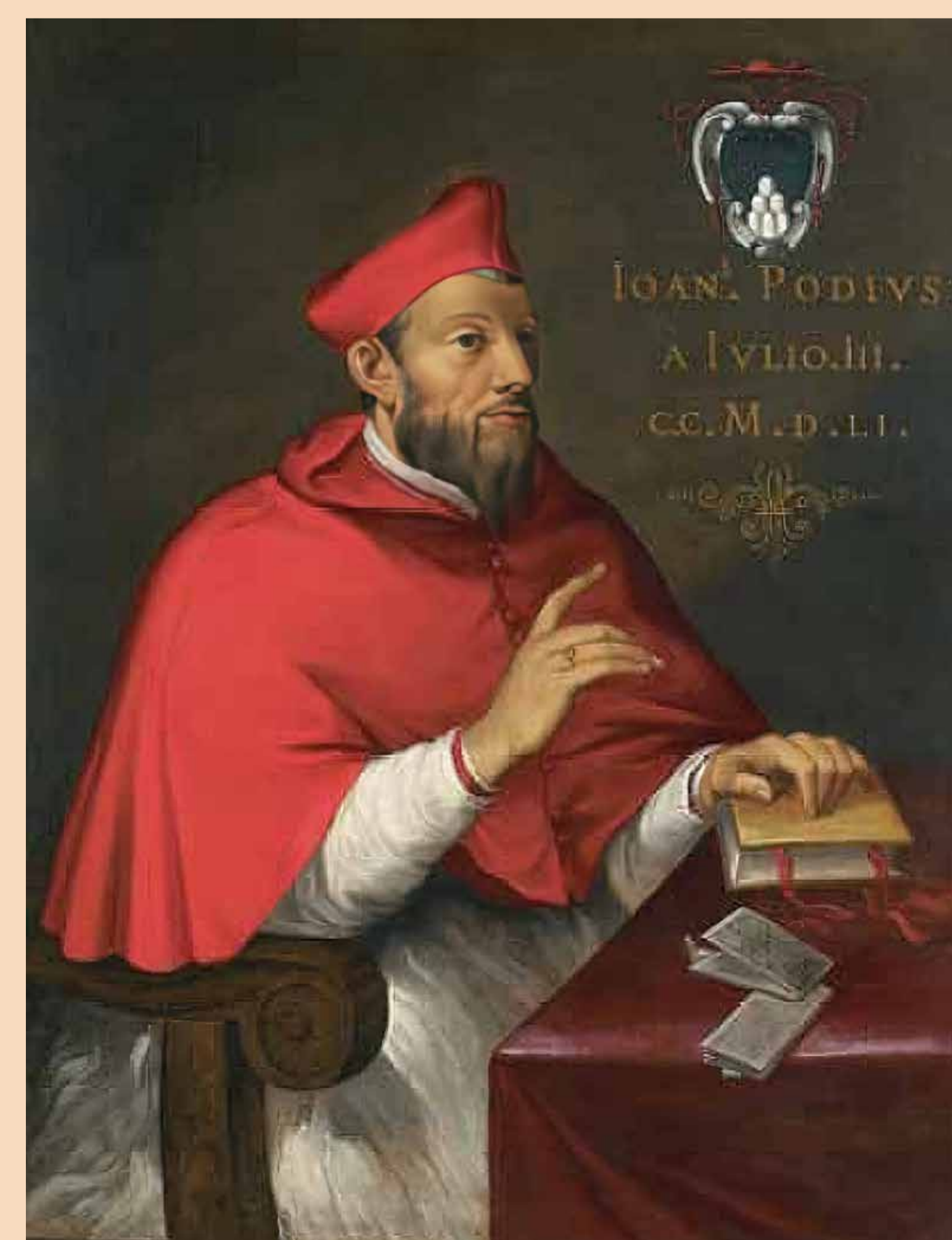
Fig.4. Retrat del cardenal Giovanni Poggio (autor desconegut).