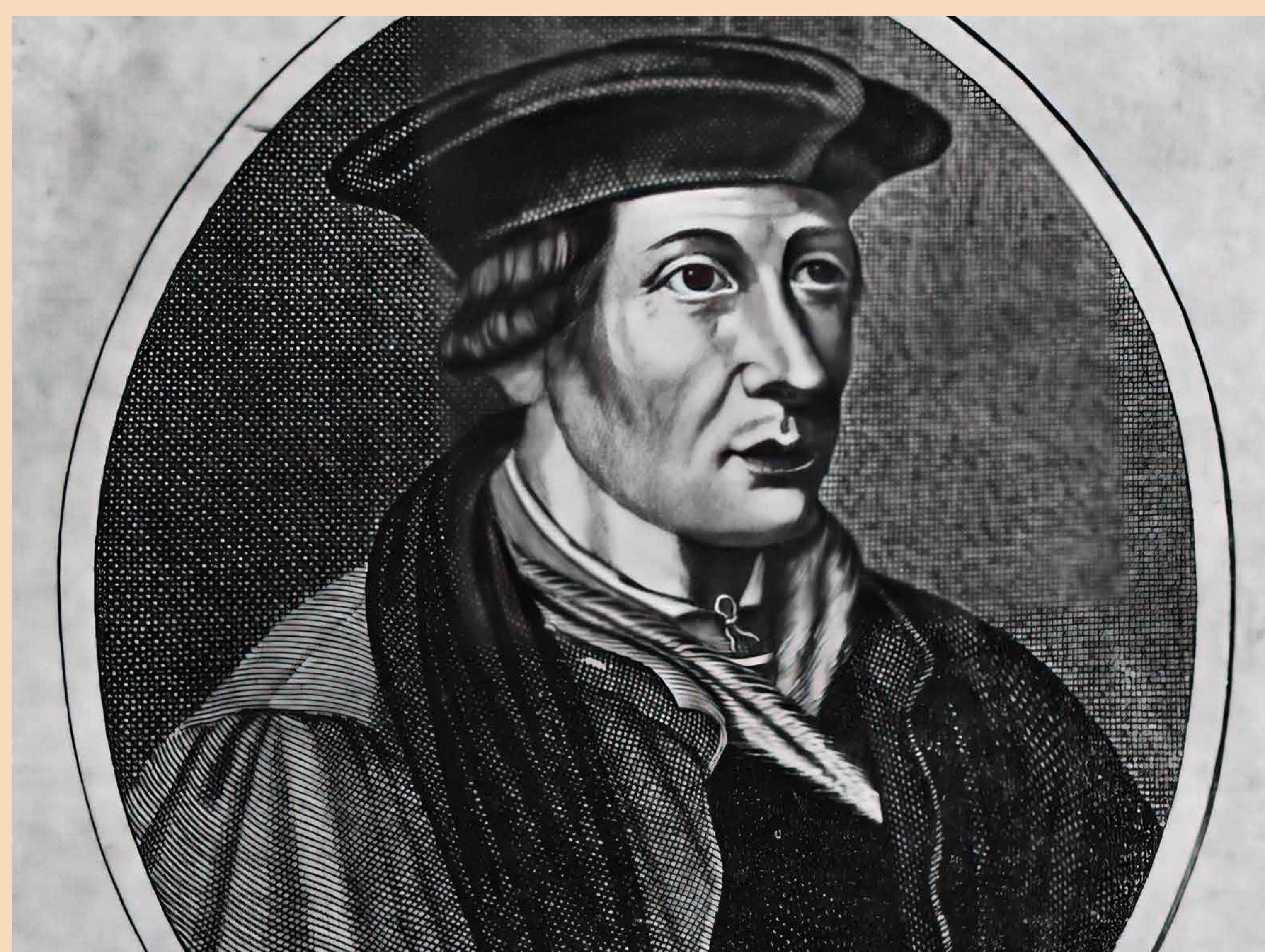
Fig.2. Retrat de Finé (autor desconegut).